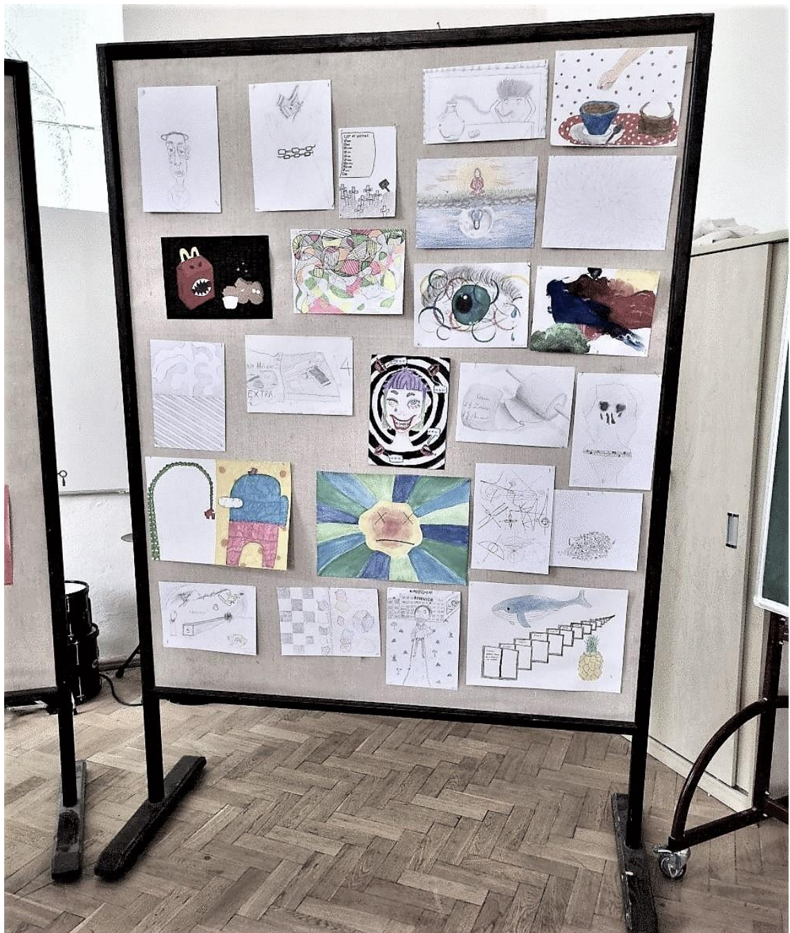
Obrázek 4 Almanach 2022