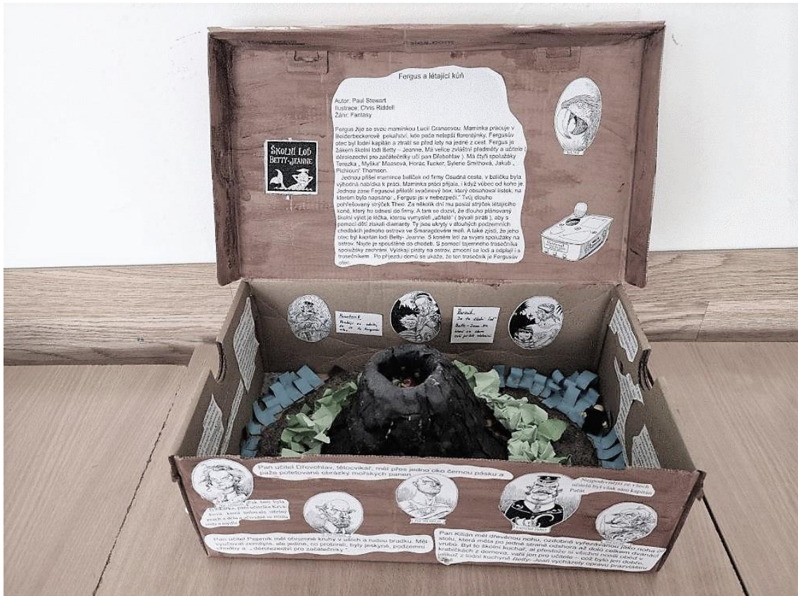
Obrázek 6 Almanach 2022

Všechno má stále silnější fialový odstín a s prvním ranním zaržáním koně od smíchovského pivovaru Ferdinanda B. opouští i ta poslední tupá bolest v hlavě.