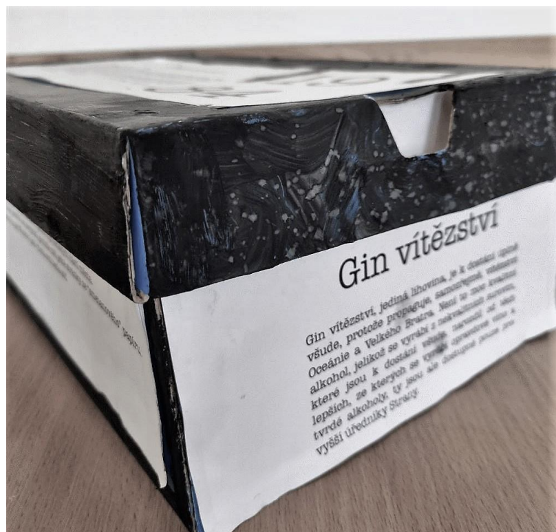
Obrázek 3 Almanach 2022