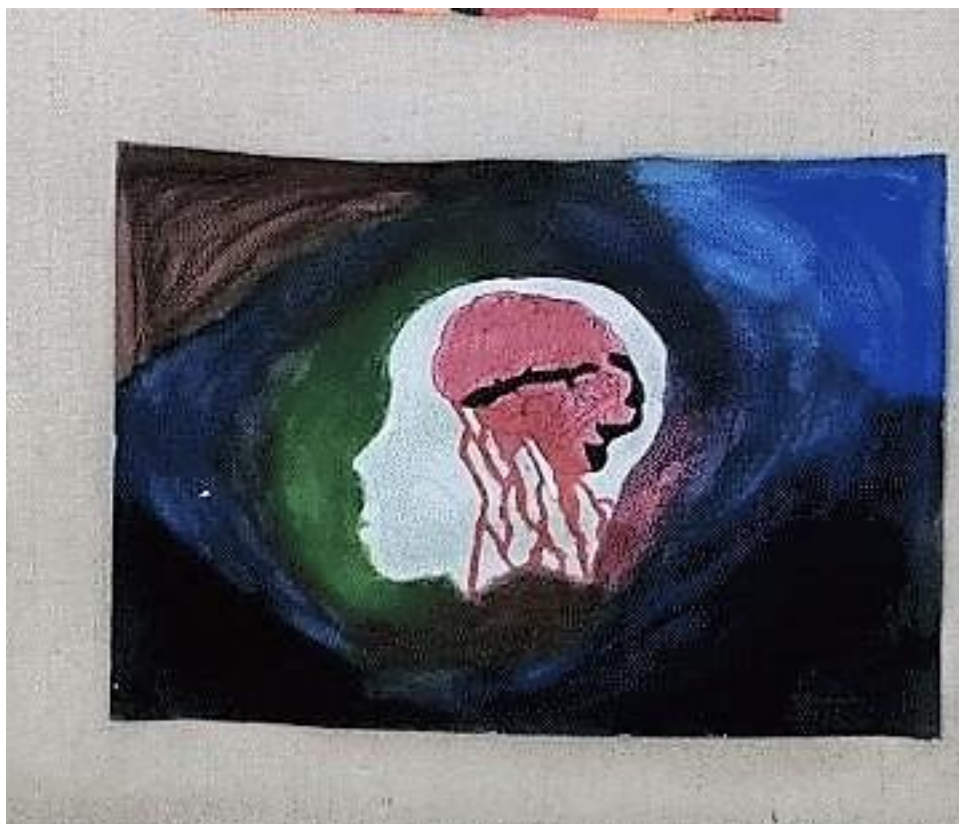
Obrázek 7 Almanach 2022