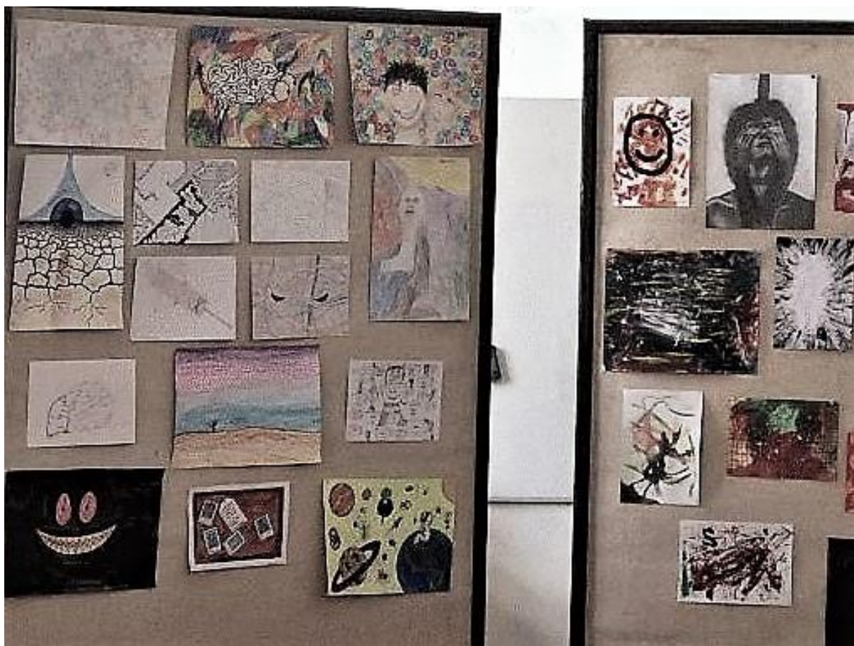
Obrázek 1 Almanach 2022

Po pěti minutách běhu uviděli mezi stromy světlo a zajásali. Ale nezastavili, doběhli až na kraj lesa a ocitli se před školou. Až u školy zastavili a tam jim normální učitelé pomohli dostat se bezpečně domů.