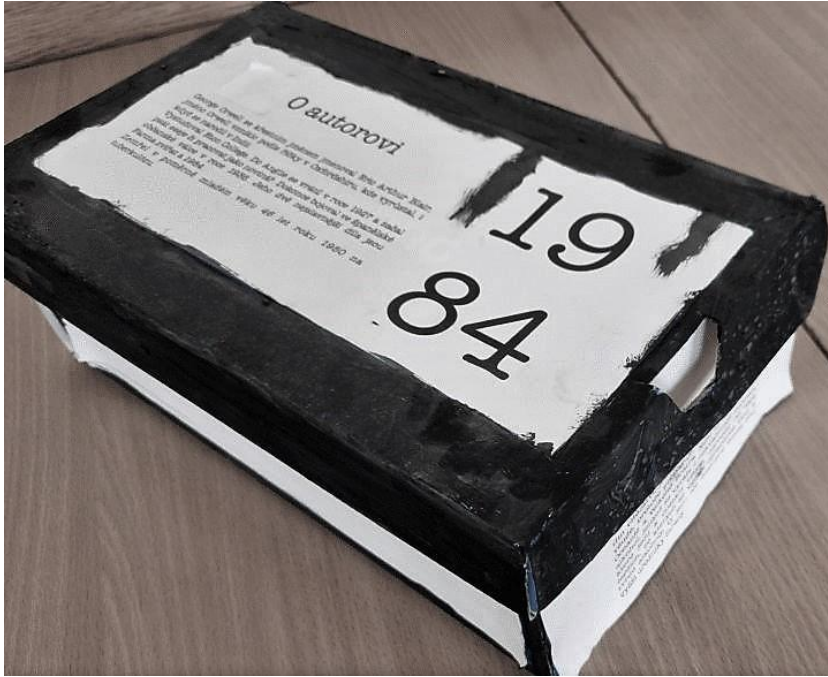
Obrázek 2 Almanach 2022