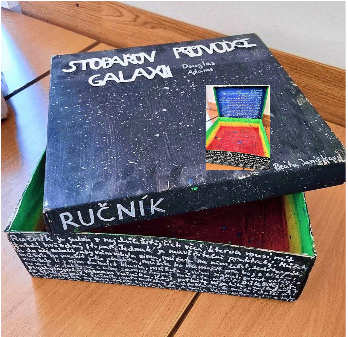
Obrázek 5 Almanach 2022